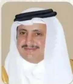
الشيخ خليفة بن جاسم آل ثاني رئيس غرفة تجارة وصناعة قطر النائب الثاني