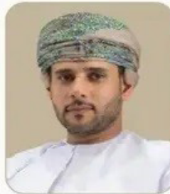
الشيخ فيصل بن عبدالله الرواس رئيس غرفة تجارة وصناعة عمان الرئيس